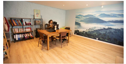
Salle de Rencontres